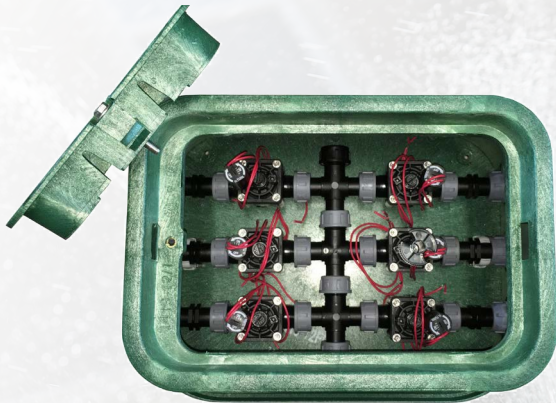
Mod. RP-VB-6 mit 6 Elektromagnetventilen und Kunststoff verschraubungen