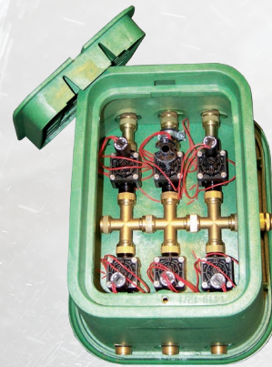
Mod. RP-VB-6-MS mit 6 Elektromagnetventilen und Messing verschraubungen